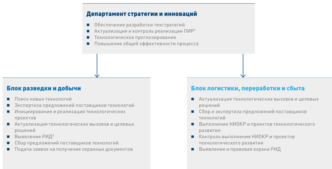
СХЕМА УПРАВЛЕНИЯ ИССЛЕДОВАНИЯМИ И ИННОВАЦИЯМИ

В 2017 г. Компания продолжила наращивать портфель интеллектуальной собственности.